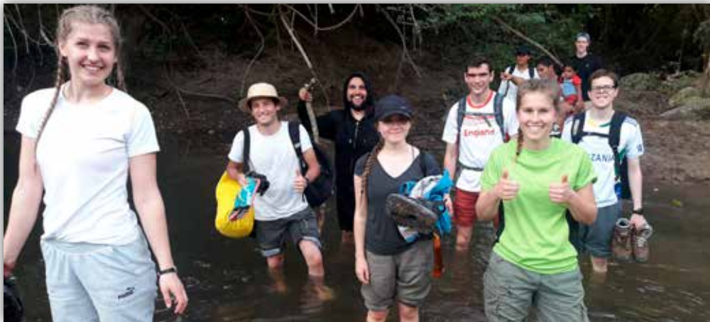
Elevene krysser en elv i Honduras

Den hyggelige atmosfæren ga en perfekt mulighet til å friske opp kontakten med vennene vi har i lokalsamfunnet. Vi håper at denne vellykkede kvelden åpner døren for mer kontakt i andre halvdel av dette Matteson-året.