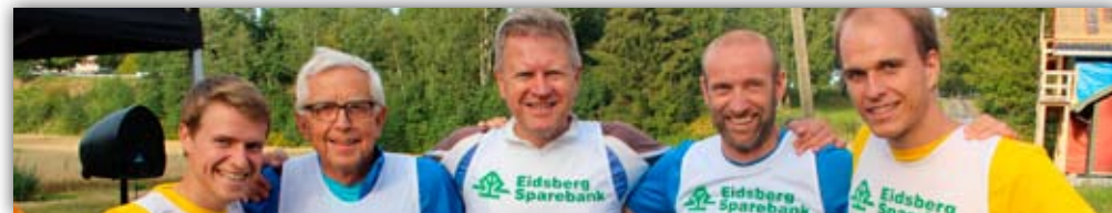
Ordfører (midten) og verdensmester (nr. 2 fra høyre) på Livsstilskubbens karuselløp

Utfordringen ble tatt imot, og det hele utviklet seg til de såkalte «karuselløpene» ved Mysenelva. Løpene fant sted hver onsdag i september, hvor det møtte opp mellom 50-80+ personer hver gang. Man kunne velge mellom 2 og 5 km, om man ønsket å gå eller løpe og om man ville ha tidtaking eller ikke. Deltakelse var det viktigste, og ønsket om å oppmuntre deltakerne til å komme seg opp, ut og i form sto sentralt.