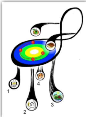
Illustrasjon: Mikaela Lillbäck

For å beskrive organisasjon, velger jeg å benytte en illustrasjon – en stol. Vitnetjeneste er utformet slik at den lokale menigheten er selve setet (evighetssymbolet) som skal fange opp de ikke-troende og hjelpe dem til å stole på Gud. Menighetens hjelpemidler, helse og evangeliet, er høyre og venstre armlene. Med disse kan menigheten utføre helsemisjonsarbeid. Stolryggen symboliserer hjelpen fra den globale SDA organisasjonen,